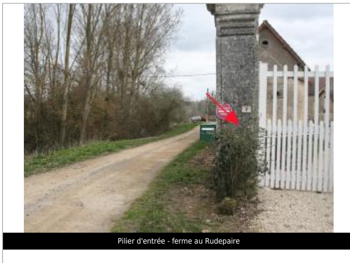
Pilier d'entrée - ferme au Rudepaire