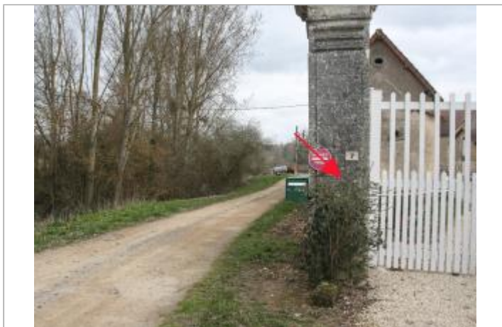
Pilier d'entrée - ferme au Rudepaire