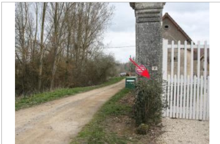
Pilier d'entrée - ferme au Rudepaire