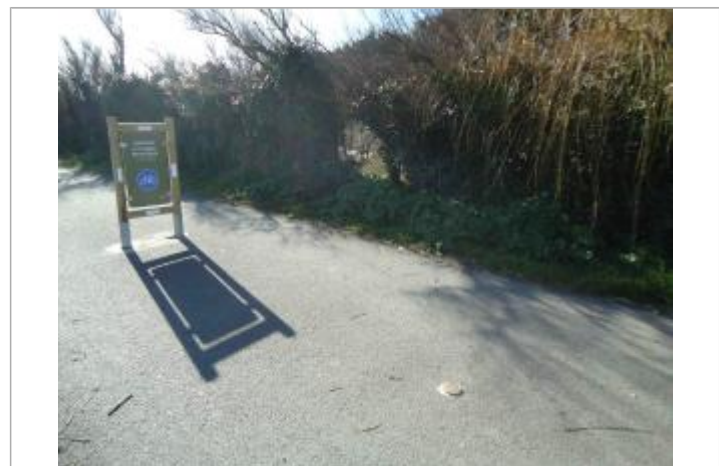
Repère Xynthia - Phare des Baleines