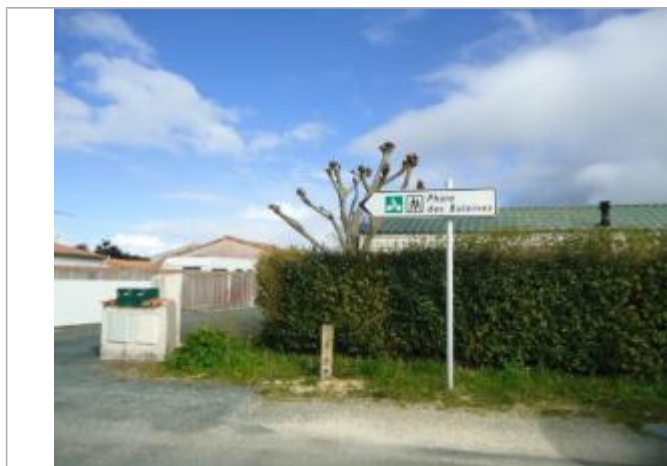
Repère Xynthia - Rue du Chaume

Méthode : GPS Commentaires sur le nivellement : Nivellement réalisé par un expert Référence nivelée : Marque d'inondation Système altimétrique : NGF IGN 1969 (système normal) Altitude de la référence (en m) : 2.590 m Altitude calculée de l'eau (en m) : 2.59 m