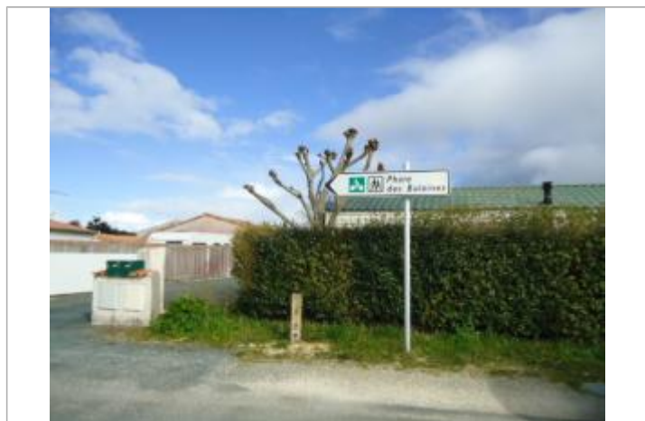
Repère Xynthia - Rue du Chaume

Méthode : GPS Commentaires sur le nivellement : Nivellement réalisé par un expert Référence nivelée : Marque d'inondation Système altimétrique : NGF IGN 1969 (système normal) Altitude de la référence (en m) : 2.590 m Altitude calculée de l'eau (en m) : 2.59 m