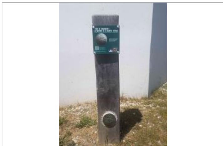
Repère Xynthia - Chemin des Perouses

Code : WEB_R_201803292412 Date de mise à jour : Auteur : Communauté de Communes Ile de Re 17/09/2021