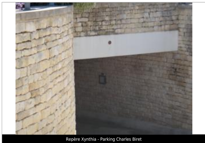
Repère Xynthia - Parking Charles Biret

Méthode : GPS Commentaires sur le nivellement : Nivellement réalisé par un géomètre expert Référence nivelée : Marque d'inondation Système altimétrique : NGF IGN 1969 (système normal) Altitude de la référence (en m) : 3.130 m Altitude calculée de l'eau (en m) : 3.13