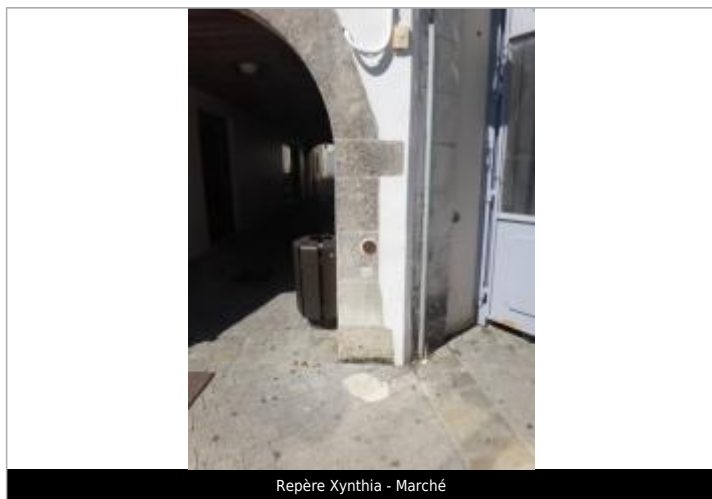
Repère Xynthia - Marché

Méthode : GPS Commentaires sur le nivellement : Nivellement réalisé par un géomètre expert Référence nivelée : Marque d'inondation Système altimétrique : NGF IGN 1969 (système normal) Altitude de la référence (en m) : 4.600 m Altitude calculée de l'eau (en m) : 4.6 m