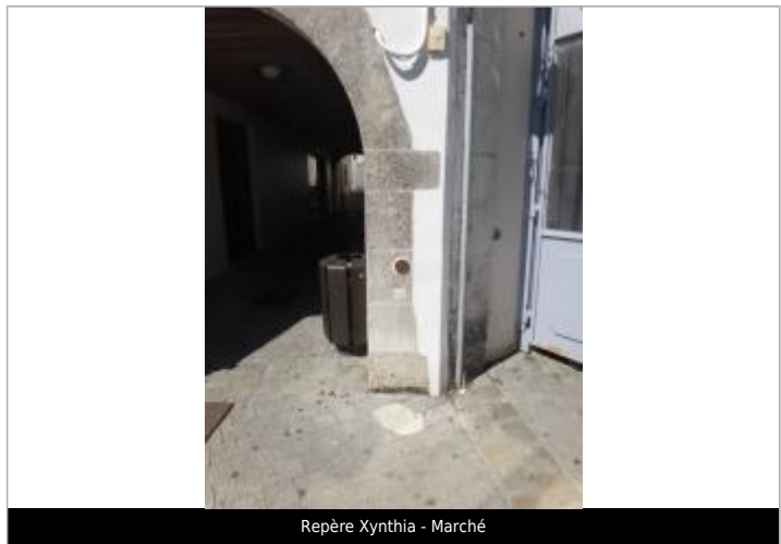
Repère Xynthia - Marché

MARQUE Texte : Xynthia 2010 Visibilité : Oui