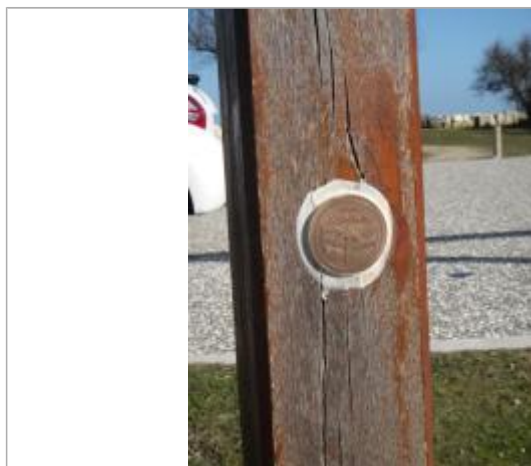
Repère Xynthia - Parking Le Marais

Méthode : GPS Commentaires sur le nivellement : Nivellement réalisé par un géomètre expert Référence nivelée : Marque d'inondation Altitude de la référence (en m) : 4.560 m Altitude calculée de l'eau (en m) : 4.56 m