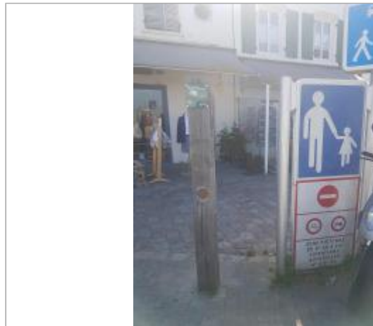
Le Port _ Quai de Sénac