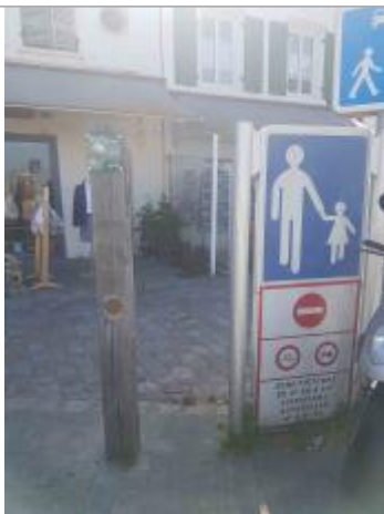
Repère Xynthia - Port

Altitude calculée de l'eau (en m) : 4.76 m