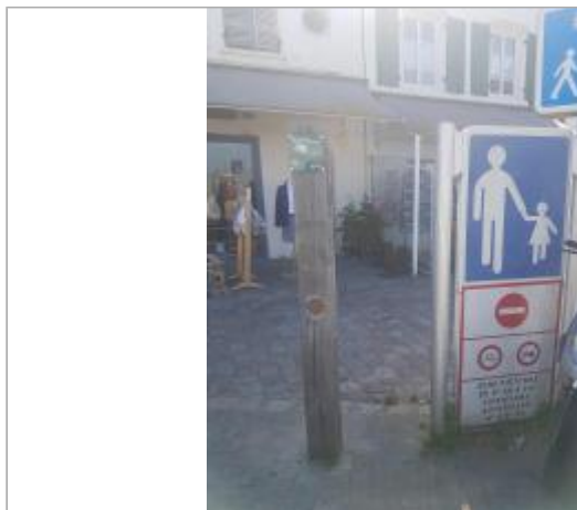
Le Port _ Quai de Sénac

Coordonnées WGS84 : X: -1.32446560 / Y: 46.18748900