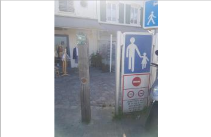
Le Port _ Quai de Sénac