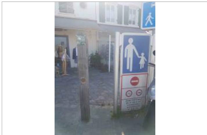
Repère Xynthia - Port

Méthode : GPS Commentaires sur le nivellement : Nivellement réalisé par un géomètre expert Référence nivelée : Marque d'inondation Système altimétrique : NGF IGN 1969 (système normal) Altitude de la référence (en m) : 4.760 m Altitude calculée de l'eau (en m) : 4.76