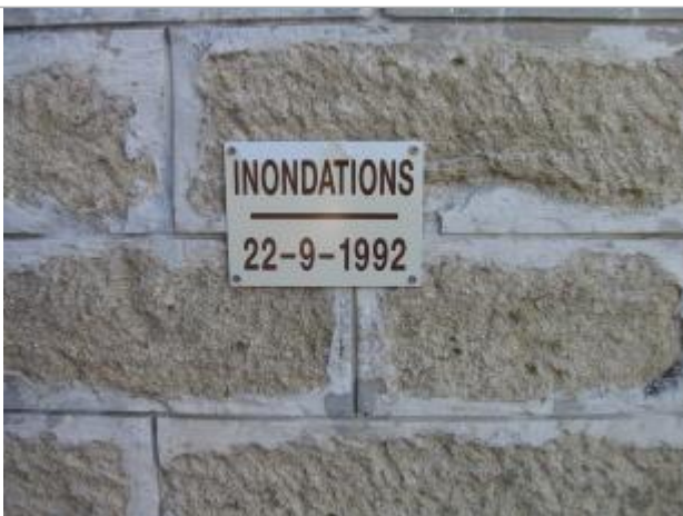
Repère de crue de l'Ouvèze