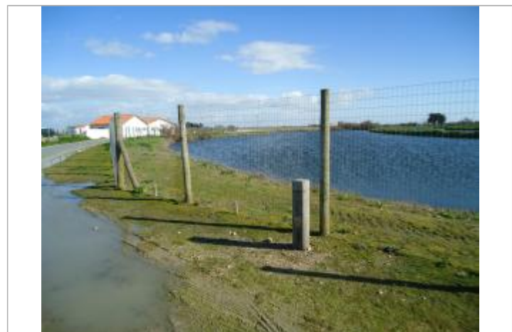
Repère Xynthia - Le Goisil