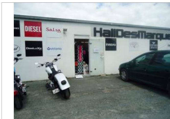
Repère Xynthia - Route d'Ars

Code : WEB_R_201803284952 Date de mise à jour : Auteur : Communauté de Communes Ile de Re 06/06/2018