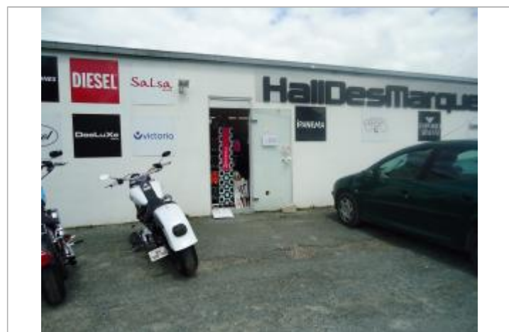
Repère Xynthia - Route d'Ars

GÉNÉRAL Code : WEB_R_201803284952 Date de mise à jour : 06/06/2018 Auteur : Communauté de Communes Ile de Re