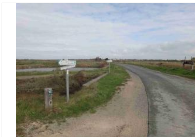
Repère Xynthia - Piste Cyclable

Code : WEB_R_201803284231 Date de mise à jour : Auteur : Communauté de Communes Ile de Re 03/09/2018