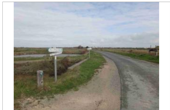
Repère Xynthia - Piste Cyclable - Dieppe/ Les Levées neuves