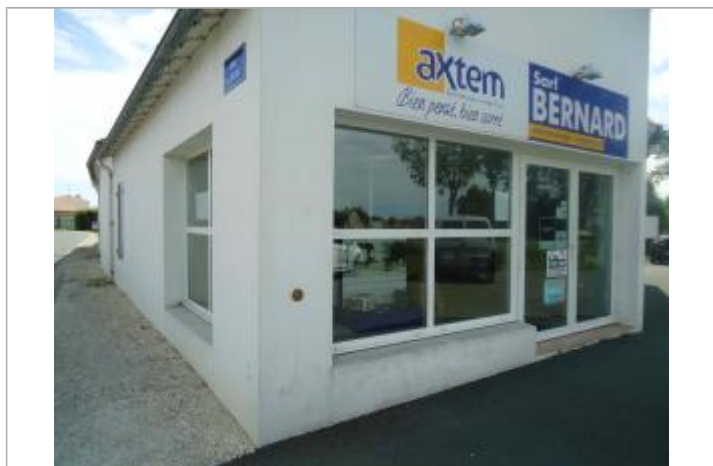
Repère Xynthia - Route du Goisil

Méthode : GPS Commentaires sur le nivellement : Nivellement réalisé par un géomètre expert Référence nivelée : Marque d'inondation Système altimétrique : NGF IGN 1969 (système normal) Différence entre le niveau d'eau et la référence (en m) : 3.300 m