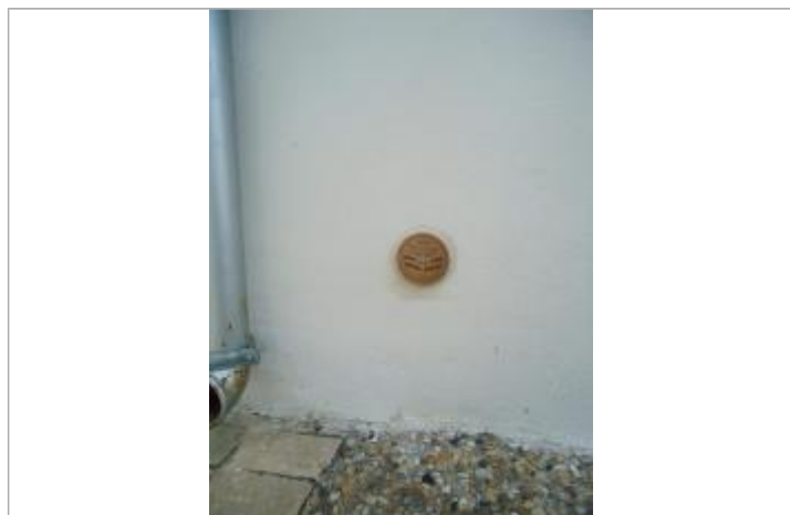
Repère Xynthia -Rue du Ventoux

Méthode : GPS Commentaires sur le nivellement : Nivellement réalisé par un géomètre expert Référence nivelée : Marque d'inondation Altitude de la référence (en m) : 2.970 m Altitude calculée de l'eau (en m) : 2.97 m