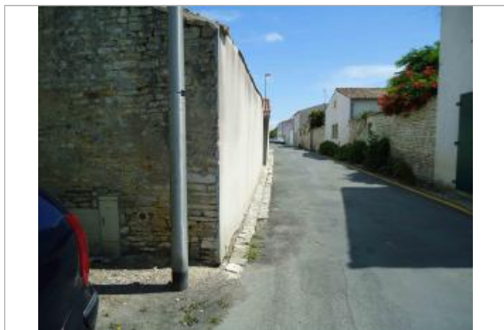
Repère Xynthia - Cours des Poilus

Méthode : GPS Commentaires sur le nivellement : Nivellement réalisé par un géomètre expert Référence nivelée : Marque d'inondation Système altimétrique : NGF IGN 1969 (système normal) Altitude de la référence (en m) : 3.290 m Altitude calculée de l'eau (en m) : 3.29 m