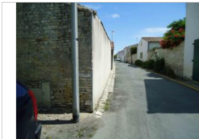
Repère Xynthia - Cours des Poilus

Méthode : GPS Commentaires sur le nivellement : Nivellement réalisé par un géomètre expert Référence nivelée : Marque d'inondation Système altimétrique : NGF IGN 1969 (système normal) Altitude de la référence (en m) : 3.290 m Altitude calculée de l'eau (en m) : 3.29 m