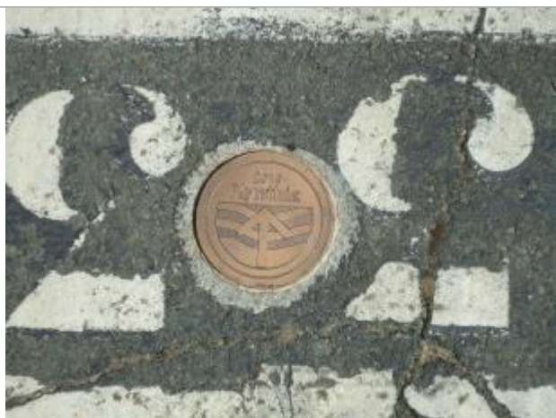
Repère Xynthia - Piste Cyclable

Méthode : GPS Commentaires sur le nivellement : Nivellement réalisé par un géomètre expert Référence nivelée : Marque d'inondation Système altimétrique : NGF IGN 1969 (système normal) Altitude de la référence (en m) : 3.070 m Altitude calculée de l'eau (en m) : 3.07 m