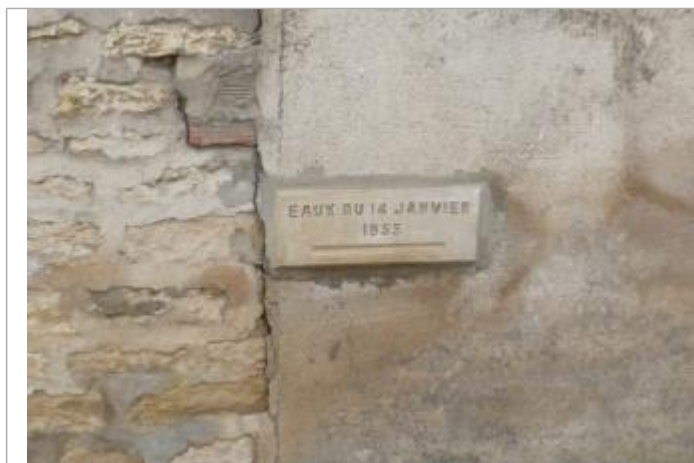
photo de détail