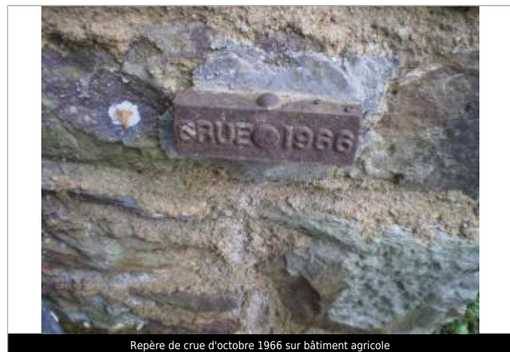
Repère de crue d'octobre 1966 sur bâtiment agricole