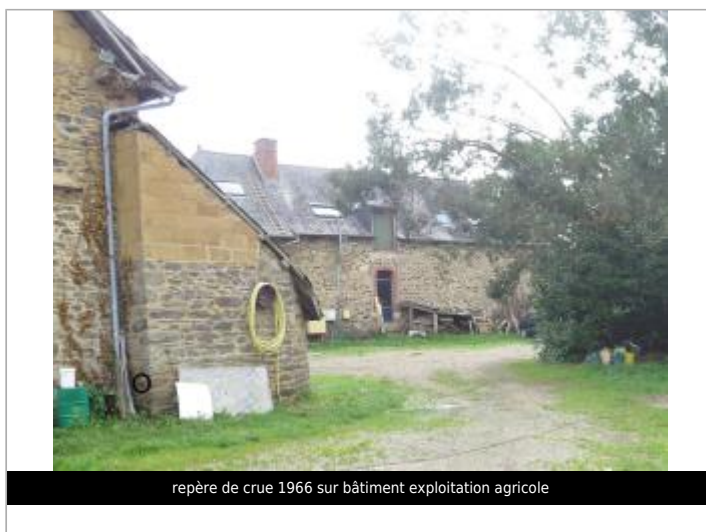
repère de crue 1966 sur bâtiment exploitation agricole