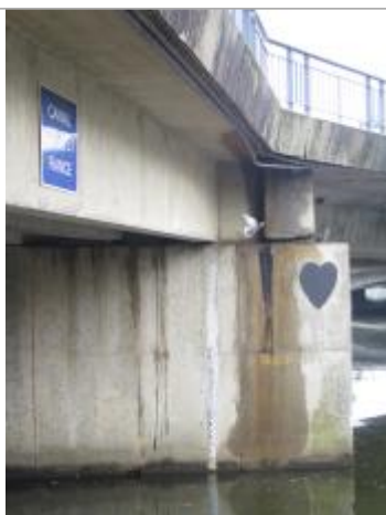
Echelle limnimétrique en aval de l'écluse du Mail

Altitude calculée de l'eau (en m) : 25.314 m