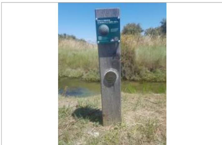
Repère Xynthia - rue de Mouillebarbe

Altitude calculée de l'eau (en m) : 2.67