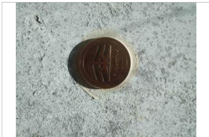
Repère Xynthia - Venelle de la Clé des Champs

Méthode : GPS Commentaires sur le nivellement : Nivellement réalisé par un géomètre expert Référence nivelée : Marque d'inondation Système altimétrique : NGF IGN 1969 (système normal) Altitude de la référence (en m) : 3.650 m Altitude calculée de l'eau (en m) : 3.65