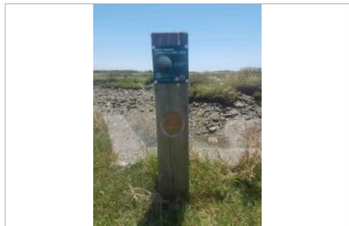
Repère Xynthia - Potelet - Route de la Prée