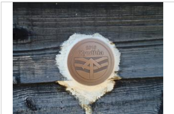
Coopérative des sauniers de l'Ile de Ré

Méthode : GPS Commentaires sur le nivellement : Nivellement réalisé par un géomètre expert Référence nivelée : Marque d'inondation Altitude de la référence (en m) : 3.360 m Altitude calculée de l'eau (en m) : 3.36