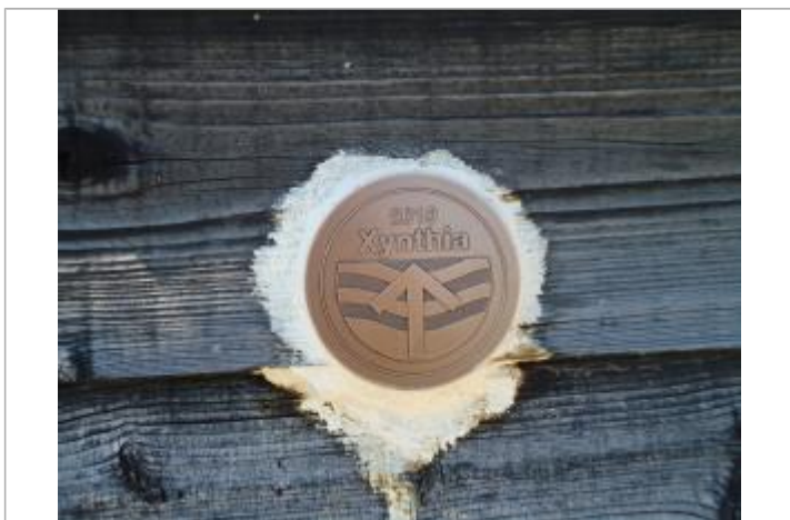
Coopérative des sauniers de l'Ile de Ré

Méthode : GPS Commentaires sur le nivellement : Nivellement réalisé par un géomètre expert Référence nivelée : Marque d'inondation Altitude de la référence (en m) : 3.360 m Altitude calculée de l'eau (en m) : 3.36