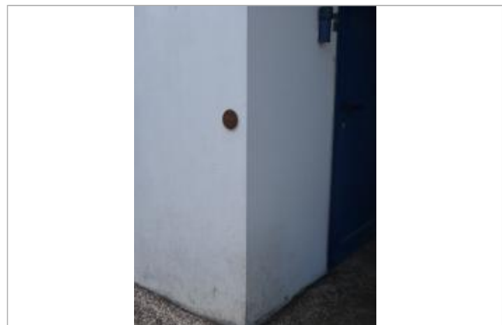
Repère Xynthia - rue Charles De Gaulle