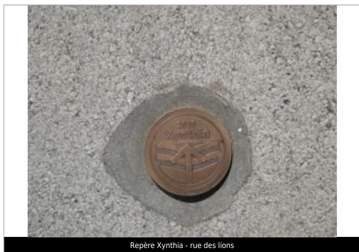
Repère Xynthia - rue des lions

Méthode : GPS Commentaires sur le nivellement : Nivellement réalisé par un géomètre expert Référence nivelée : Marque d'inondation Système altimétrique : NGF IGN 1969 (système normal) Altitude de la référence (en m) : 3.690 m Altitude calculée de l'eau (en m) : 3.69