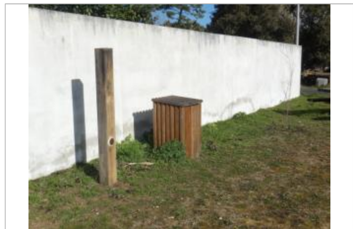
Repère Xynthia - aire de pique nique rue Charbonnière