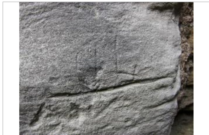
Marque 1994 - couloir intérieur côté rivière