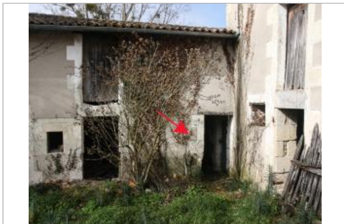
Marques côté rue (1)