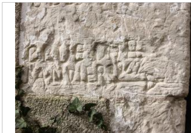
Marque 1962 - côté rue

Altitude calculée de l'eau (en m) : 56.48 m