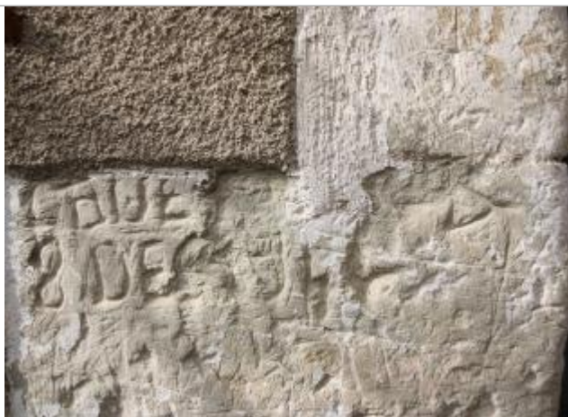
Marque 1944 - côté rue

Altitude calculée de l'eau (en m) : 56.74 m