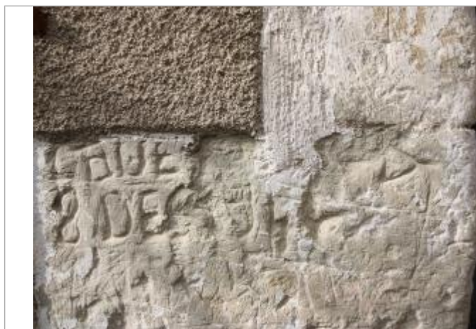
Marque 1944 - côté rue

Altitude calculée de l'eau (en m) : 56.74 m