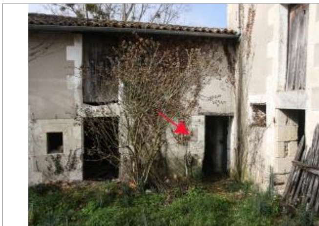
Marques côté rue (1)

Coordonnées WGS84 : X: 0.56027676 / Y: 46.69998600