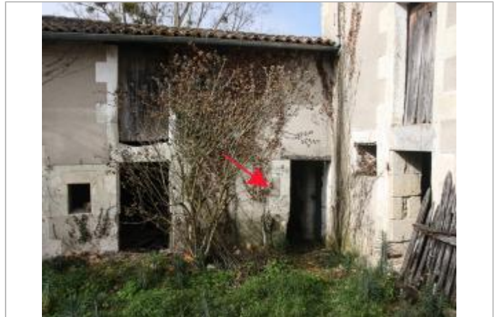
Marques côté rue (1)

Coordonnées WGS84 : X: 0.56027676 / Y: 46.69998600