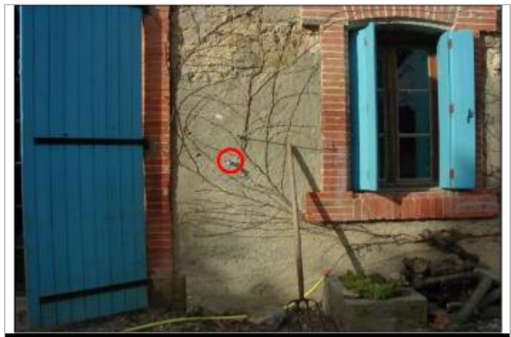
Mur de façade de maison - niveau du robinet d'eau

ENQUÊTE DDE DU 10/11/2000 - 26/03/2018 Système altimétrique : NGF IGN 1969 (système normal) Altitude de la référence (en m) : 53.390 m Différence entre le niveau d'eau et la référence (en m) : 1.400 m Altitude calculée de l'eau (en m) : 54.79 m