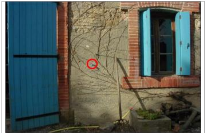
Mur de façade de maison