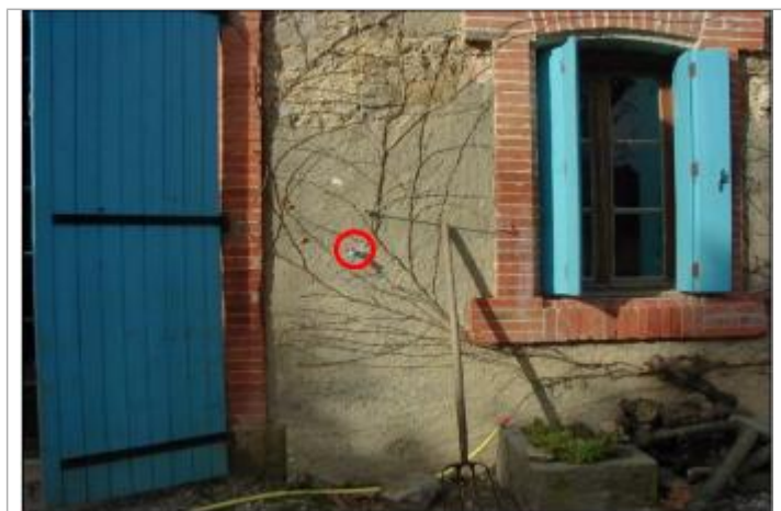
Mur de façade de maison - niveau du robinet d'eau

Système altimétrique : NGF IGN 1969 (système normal) Altitude de la référence (en m) : 53.390 m Différence entre le niveau d'eau et la référence (en m) : 1.400 m Altitude calculée de l'eau (en m) : 54.79