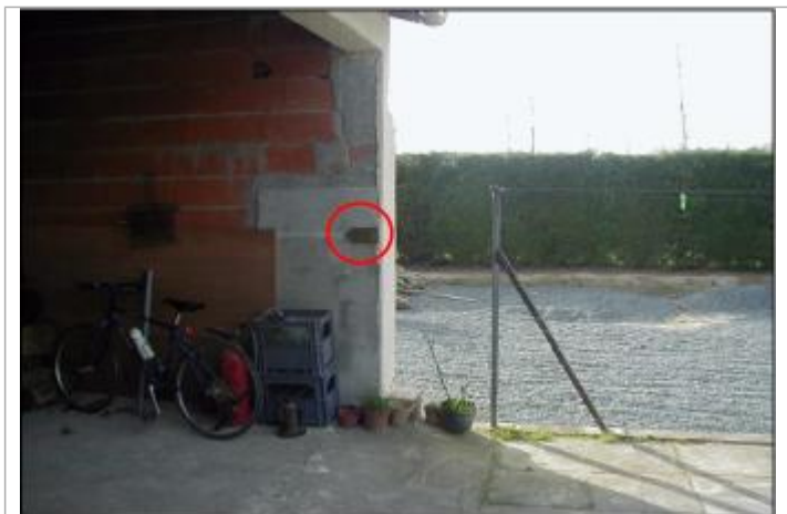
Mur du Garage

Système altimétrique : NGF IGN 1969 (système normal) Altitude de la référence (en m) : 53.390 m Différence entre le niveau d'eau et la référence (en m) : 1.300 m Altitude calculée de l'eau (en m) : 54.69