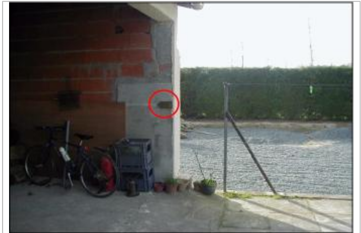
Mur du garage