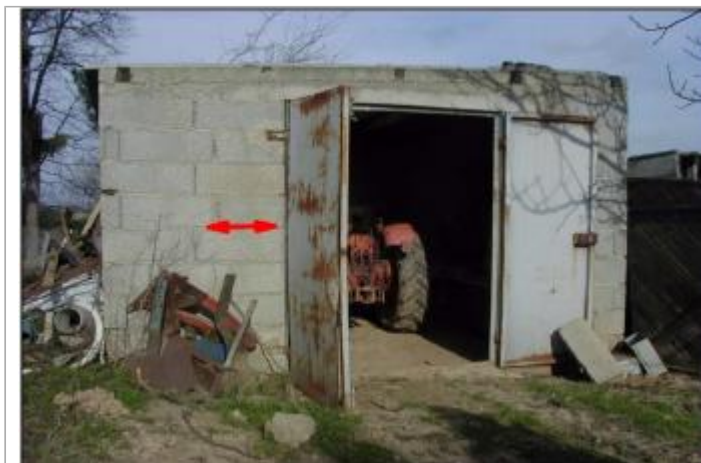
Cabane de jardin