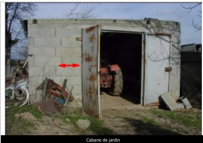
Cabane de jardin

GÉOLOCALISATION Coordonnées WGS84 : X: 2.55115100 / Y: 43.21073800 Coordonnées RGF93 (Lambert 93) X: 663501.1 / Y: 6234717.74 Coordonnées RGF93 (ETRS89) : X: 2.551151 / Y: 43.210738