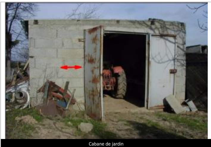
Cabane de jardin

GÉOLOCALISATION Coordonnées WGS84 : X: 2.55115100 / Y: 43.21073800 Coordonnées RGF93 (Lambert 93) X: 663501.1 / Y: 6234717.74 Coordonnées RGF93 (ETRS89) : X: 2.551151 / Y: 43.210738