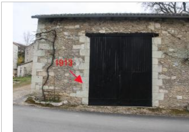
Entrée de la grange - 9 rue du port de Ribes