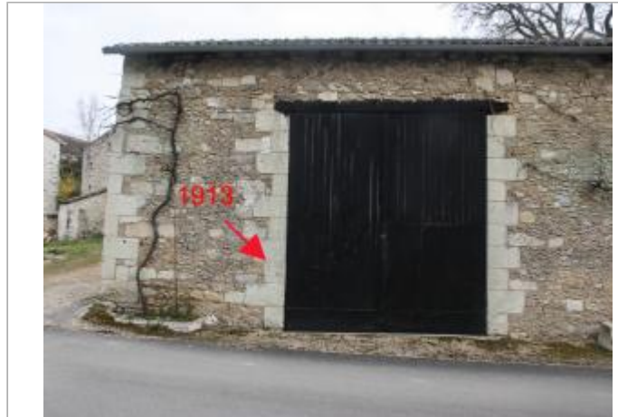
Entrée de la grange - 9 rue du port de Ribes