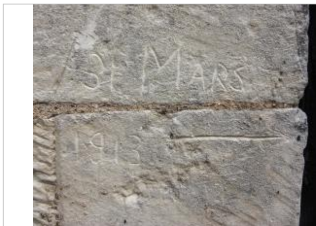
Marque inondation 31 mars 1913