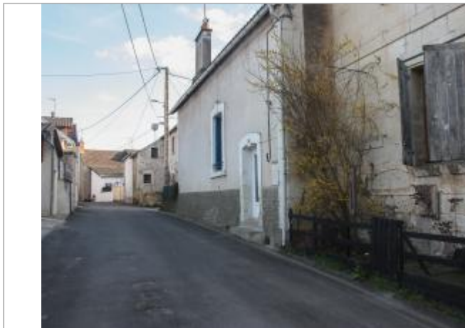
rue d'Anjou (1)