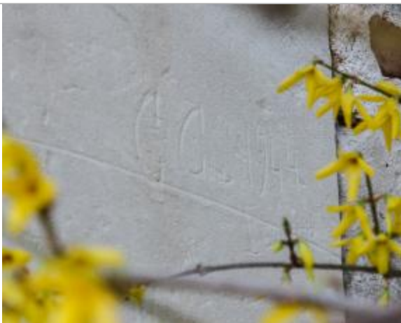
Repère de 1944

Organisme : Etablissement public du bassin de la Vienne