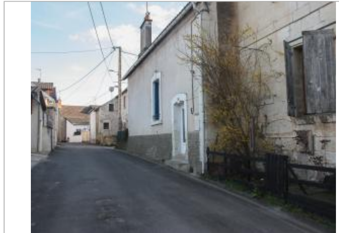
rue d'Anjou (1)