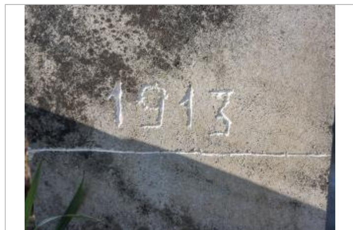
Repère de crue 1913 (2)

GÉNÉRAL Code : WEB_R_201803234104 Date de mise à jour : Auteur : EPTB_Vienne 05/08/2018