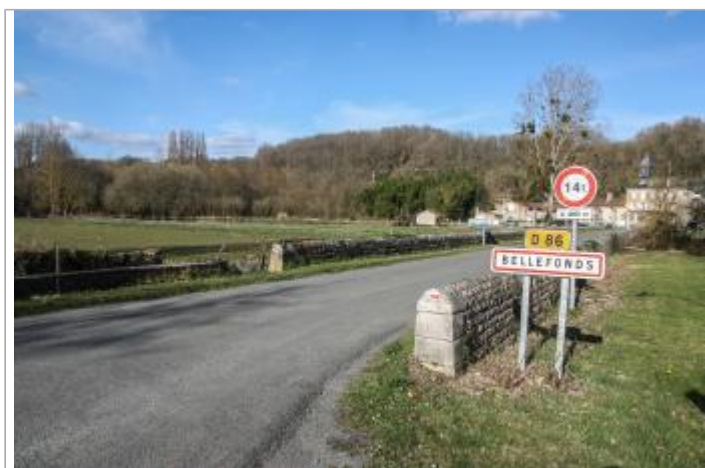
Entrée de Bellefonds / Croisement D86-D749 (1)

GÉOLOCALISATION Coordonnées WGS84 : X: 0.58723416 / Y: 46.64749000 Coordonnées RGF93 (Lambert 93) X: 515494.8 / Y: 6619198.89 Coordonnées RGF93 (ETRS89) : X: 0.5872342 / Y: 46.64749 Code Hydro: L---0060 Rive de référence: Droite