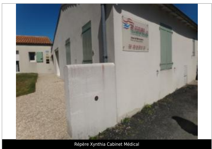
Repère Xynthia Cabinet Médical

GÉNÉRAL Code : WEB_R_201803231624 Date de mise à jour : Auteur : Communauté de Communes Ile de Re 06/06/2018