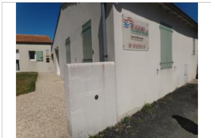
Repère Xynthia Cabinet Médical

Texte : Xynthia 2010 Maximum de l'inondation : Oui Visibilité : Oui