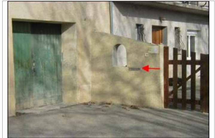
Mur de séparation