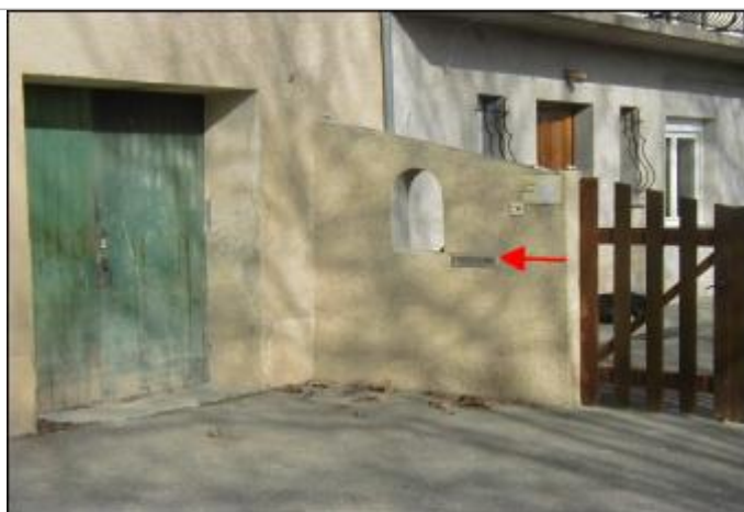
Mur de séparation

Altitude calculée de l'eau (en m) : 54.74