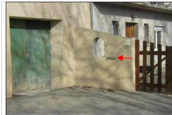
Mur de séparation