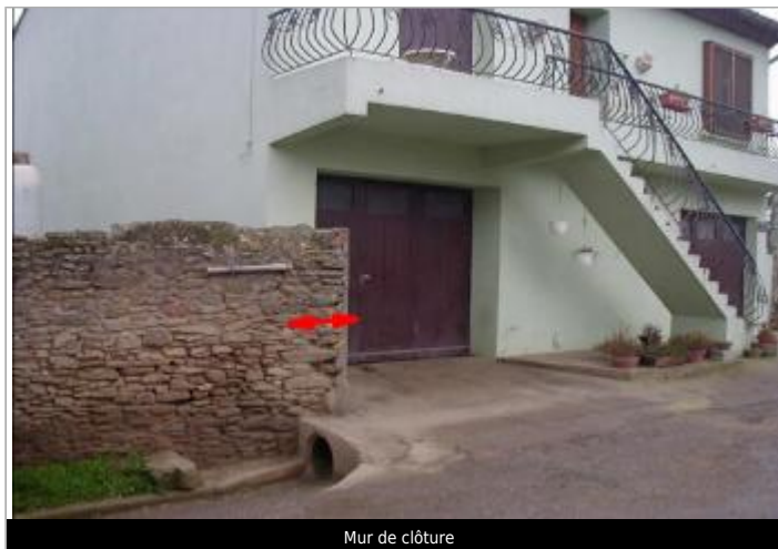
Mur de clôture