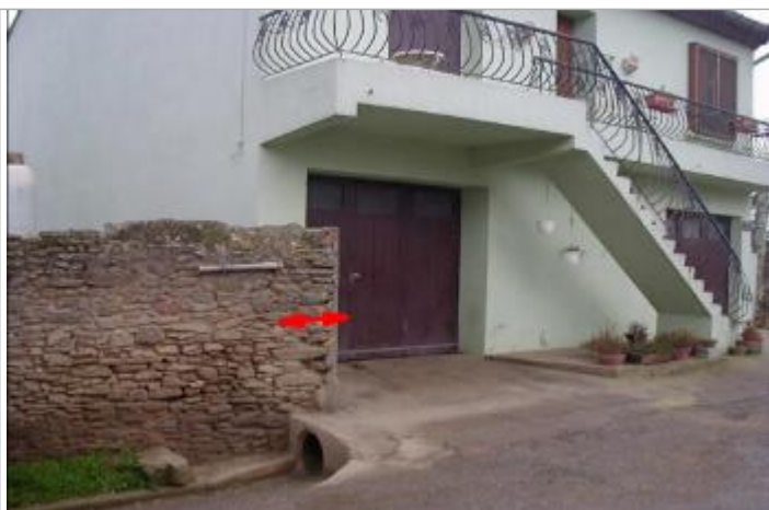
Mur de clôture

Altitude calculée de l'eau (en m) : 60.82 m