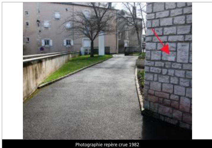
Photographie repère crue 1982

Altitude calculée de l'eau (en m) : 66.36 m