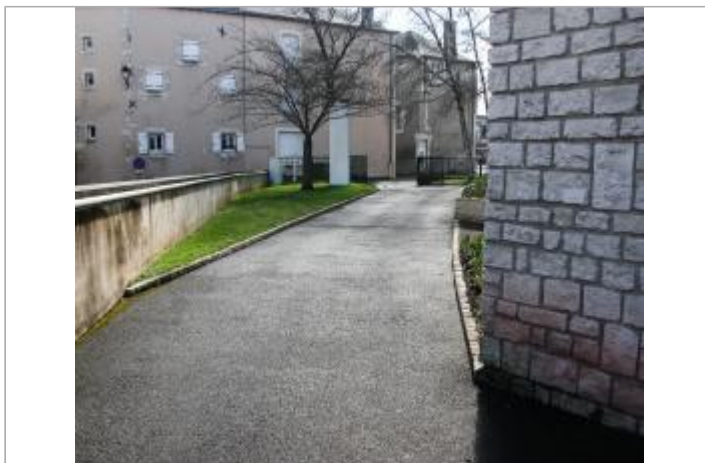
Mairie de Chauvigny (1)